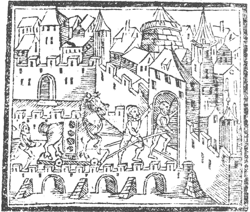
Einzug des troianischen Pferdes

Die Abbildung, die zeigt, wie das Trojanische Pferd über eine Brücke gegen die Stadt gezogen wird, meint Troia, zeigt im Hintergrund aber anhand eindeutig identifizierbarer Bauwerke wie dem massiven Befestigungs- und dem Kirchturm unverkennbar die Stadt Solothurn. Damit entspricht das Verfahren dieser Illustration demjenigen des Spiels, in welchem zahlreiche Diskurse der Gegenwart und eine auf die Zeit und das Publikum bezogene pädagogische Zielsetzung ebenfalls einen bemerkenswerten Hintergrund bilden.