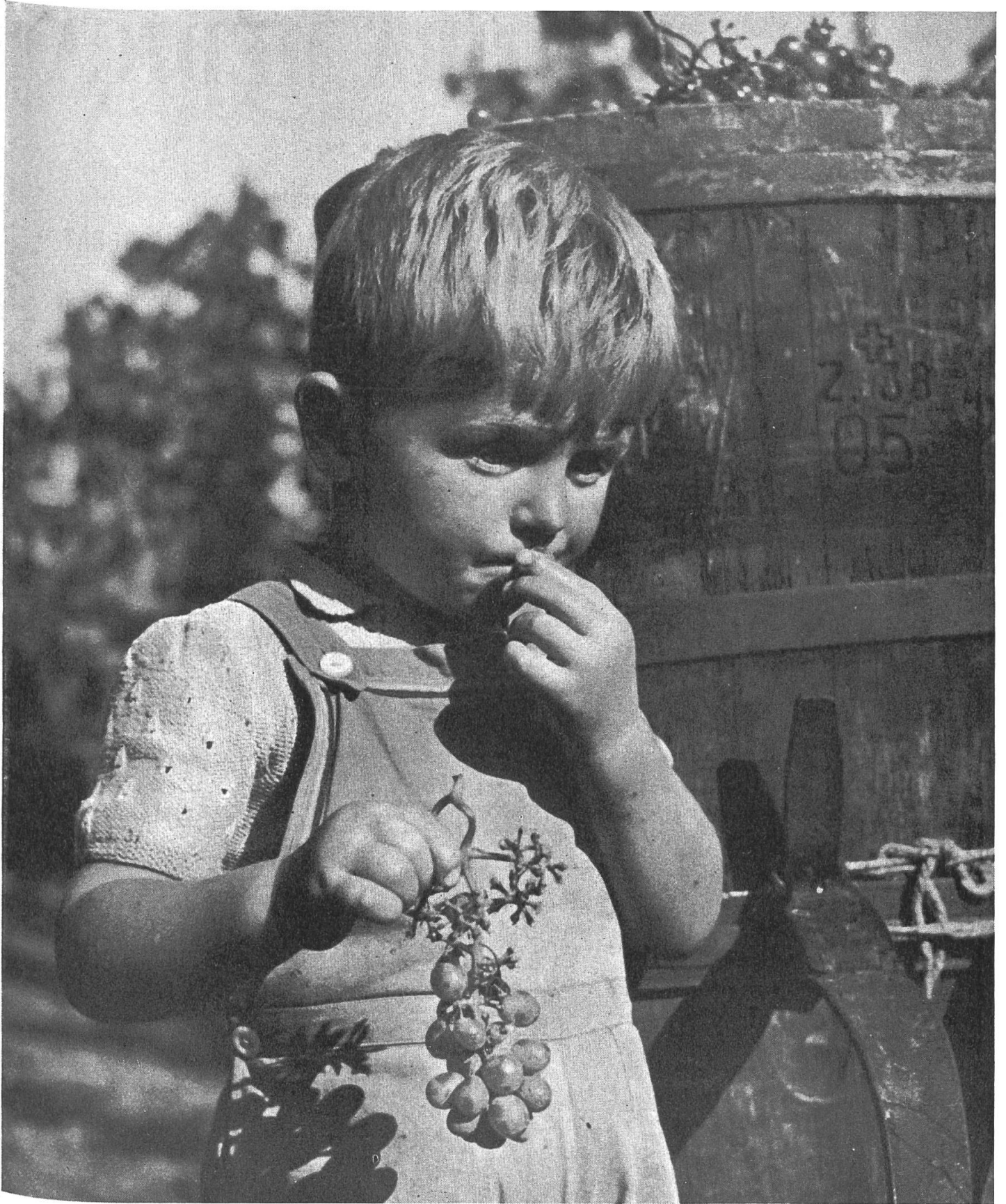
Ein kleiner Geniesser