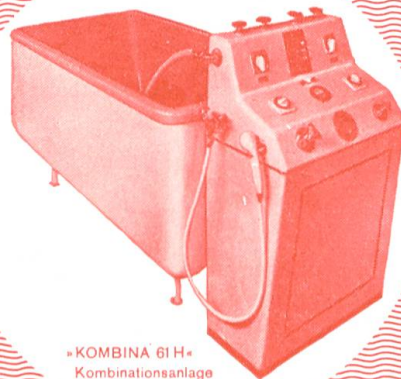
«KOMBINA 61H» Kombinationsanlage

So intensiv, so angenehm, so vielseitig und so preiswert wie die Paraffin-Universal-Kompresse ist keine andere Wärmeapplikation.