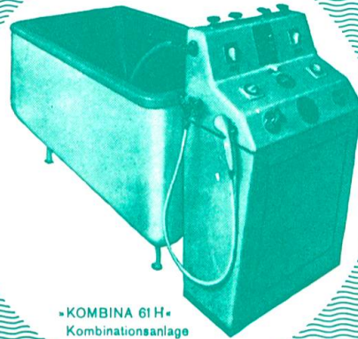
»KOMBINA 61H« Kombinationsanlage