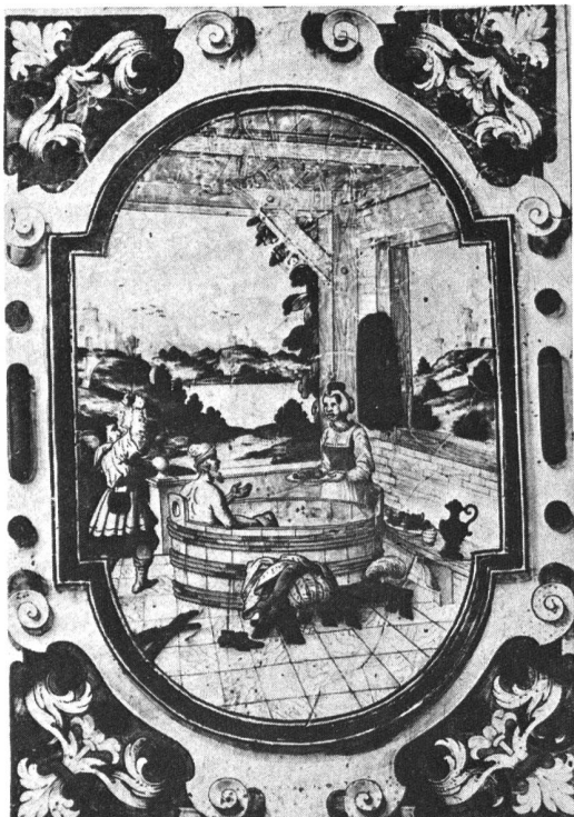
Ill. 7: Wolfenschiessen est assassiné au bain par Baumgartner furibond, parce qu'il avait voulu déshonorer la femme de celui-ci. Vitrail de 16ème siècle.