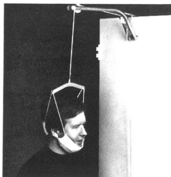
Bestell-Nr. 1806 Fr. 35.-

EXO-STATIC Zervikalzugerät an einer Türe einhängen. Spreizbügel, Glisson und Zugkordel sind inbegriffen.