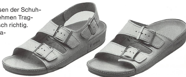
Mod. 9933 weiss + natur Gr. 36 – 46, Fr. 85.–

Ein federleichtes Fussbett, nach neuesten Erkenntnissen der Schuhtechnik und Orthopädie gebaut, sorgt für einen angenehmen Tragkomfort. In einem VITAL-Fussbett stehen Sie anatomisch richtig. Ihr vegetatives Nervensystem, sowie Ihr gesamter Organismus werden mit einem feinen Massage-Fussbett angeregt. Schenken Sie Ihren Füßen Ihre volle Aufmerksamkeit und wählen Sie VITAL. VITAL-Sandaletten gibt es in diversen Ausführungen, erhältlich bei