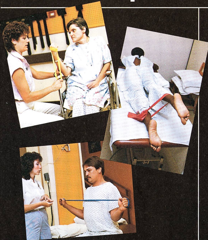
5 abgestufte Zugstärken, durch Farben leicht zu unterscheiden. Rollen 15 cm breit, 5,5 m lang.

THERA-BAND , das neuartige, elastische Übungsband für abstuftbare Widerstandsübungen, wird von Therapeuten bevorzugt, weil sie damit ein eigenes, preiswertes, wirksames und vielseitig abwandelbares Program aufbauen können, sowohl für aktive, als auch für Widerstandsübungen. Übungen, mit THERA-BAND durchgeführt, bewähren sich in der Orthopädie, der Rehabilitation und der postoperativen Mobilisation. Ihr Patient gewinnt rascher an Kraft, sein Bewegungsumfang wird grösser und die Koordination von Muskelgruppen wird besser.