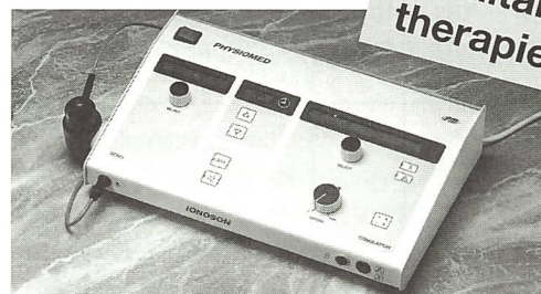
Mietkauf ab Fr. 175.– monatlich