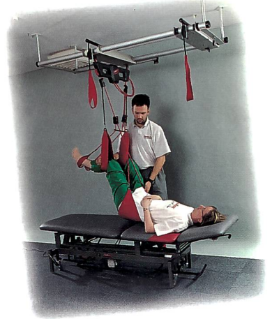
Die dritte Hand des Therapeuten