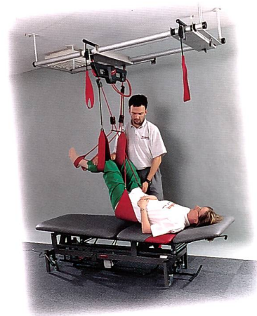
Die dritte Hand des Therapeuten