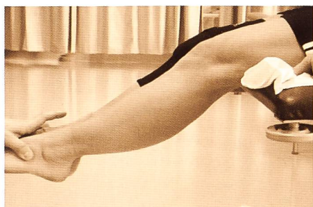
Figure 3: Amélioration de la proprioception par l'utilisation d'une genouillère élastique.

Elle permet un développement du potentiel neuromusculaire et, sans être une finalité, constitue néanmoins une étape souvent obligatoire [48]. Elle doit être adaptée à la technique thérapeutique retenue, à l'objectif moteur du patient et aux délais de cicatrisation.