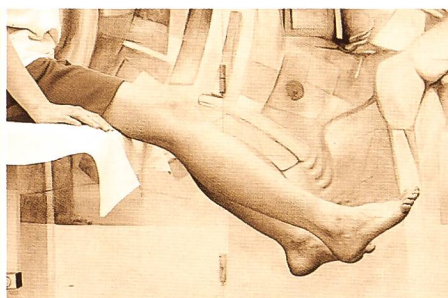
Figure 4: Noter la différence de position articulaire entre les deux genoux (par contrôle de hauteur des deux talons).