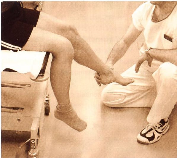
Figure 1: Exemple de test actif de proprioception. Le sujet est assis sur une table d'examen, sans contact de la face postérieure du genou avec la table. Les yeux sont fermés. L'examineur place lentement et passivement le membre sain dans une position de flexion du genou (entre 30 et 60°) puis demande de replacer activement son genou lésé dans la même position que son genou sain.

Pour Friden [27] les tests ont une meilleure reproductibilité à 20° de flexion du genou. Borsa [28] montre que lors des tests, le déficit est plus sensible vers 15° d'extension et en déplaçant le segment jambier de la flexion vers l'extension. Good [29] teste la proprioception en position debout, en charge. Il obtient une «overestimation» des deux côtés. Pour lui, les signaux afférents qui sont compromis par une lésion aiguë du LCA sont insignifiants comparés aux signaux afférents fournis par les autres articulations et les récepteurs des muscles.