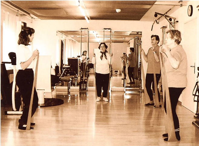
III. 4: Groupe Force (Theraband)