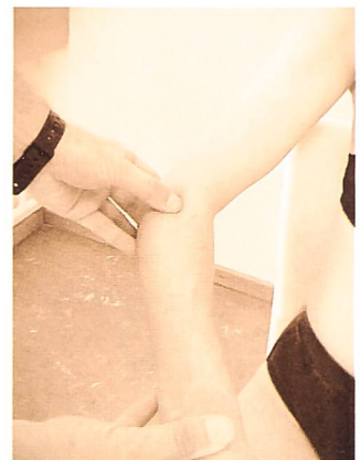
Fig. 11: Épicondyles sensibles à la palpation

Ces différents niveaux et ces différentes structures sont au fait des interfaces mécaniques et influencent directement la mobilité en étirement-glisserment du système nerveux. Il est donc stratégiquement judicieux de traiter d'abord ces interfaces et d'objectiver systématiquement étape par étape par les tests de mise sous tension le résultat obtenu.