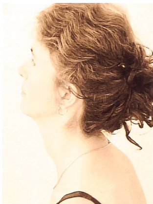
Fig. 8: Déficit en extension du rachis au delà de C6