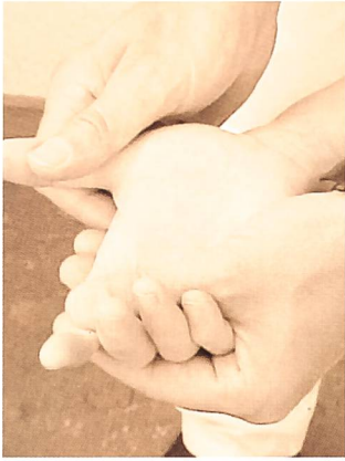
Fig. 12: Déficit au niveau de l'abduction du pouce