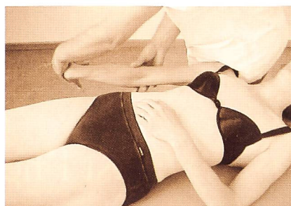
Fig. 6: Mise sous tension du nerfs radial