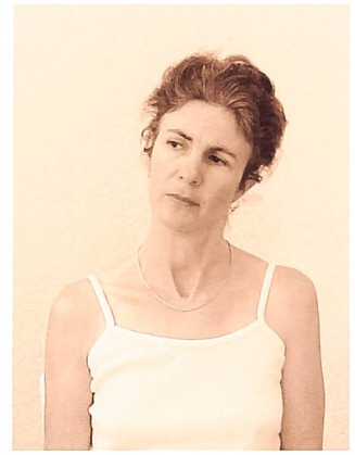
Fig. 4: Dépression de l'épaule, inclinaison controlatérale de la nuque et rotation de la tête homolatérale pour la mise en tension du faisceau supérieur du trapèze. Fermeture du défilé des scalènes contenant le paquet vasculo-nerveux.