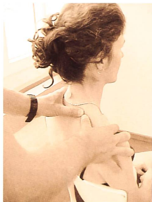
Fig. 9: Première côte douloureuse à la palpation