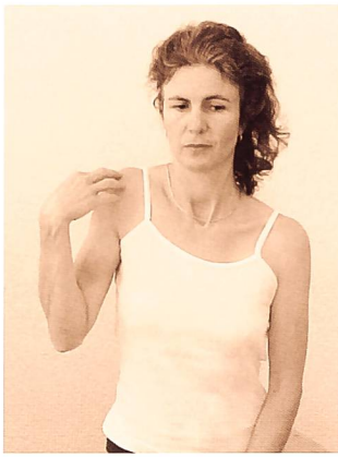
Fig. 1: Membre supérieur en position neutre, le coude fléchi une élévation/dépression de l'épaule induit un grand mouvement du système nerveux par rapport aux interfaces.