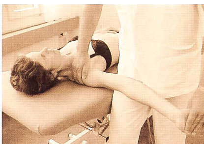
Fig. 5: Mise sous tension du nerfs médian