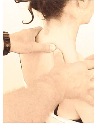
Fig. 14: Mobilisation des côtes en postéro-antérieur