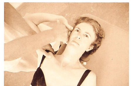
Fig. 7: Mise sous tension du nerfs cubital