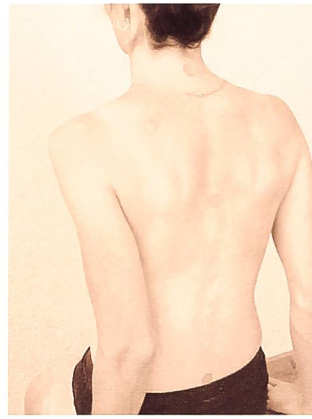
Fig. 3: Points de tension. Ils peuvent expliquer certaines douleurs locales lors d'une participation de structures neurales au problème actuel du patient.