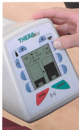
Symmetrietraining zeigt messbaren Therapieerfolg

Beim neuen THERA-Vital Bewegungstrainer ist der Übungserfolg ständig im Blickfeld: Therapiezeit, Puls, Geschwindigkeit, Leistung und Muskeltonus sind auf dem Monitor übersichtlich dargestellt. Erstmals kann die Rechts-Links-Muskelaktivität gemessen und mittels Biofeedback visualisiert werden.