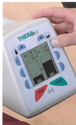
Symmetrietraining zeigt messbaren Therapieerfolg

Beim neuen THERA-Vital Bewegungstrainer ist der Übungserfolg ständig im Blickfeld: Therapiezeit, Puls, Geschwindigkeit, Leistung und Muskeltonus sind auf dem Monitor übersichtlich dargestellt. Erstmals kann die Rechts-Links-Muskelaktivität gemessen und mittels Biofeedback visualisiert werden.