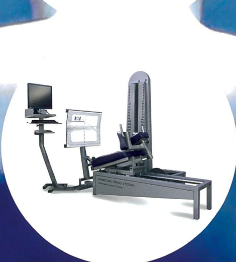
NEU: Monitored Rehab Systems Geräte-Linie.

ratio gmbh medical training rehabilitation • fitness • software Emmenhofallee 3, 4552 Derendingen Telefon 032 681 53 66 Mail: info@mrs-schweiz.ch www.mrs-schweiz.ch