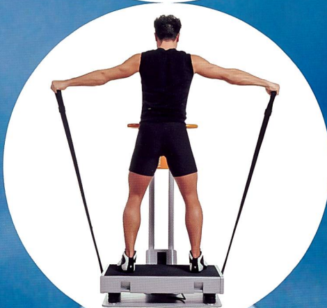
Fitvibe – das Trainingsgerät zur Ganzkörper-vibration. Verschiedene Modelle lieferbar.