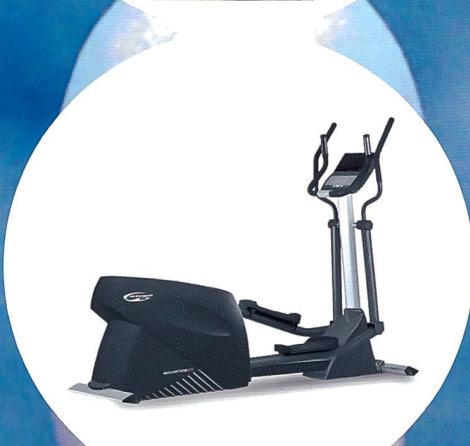
NEU: Hi-Power Cardio-Linie «500Line».