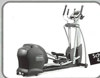
Elliptical mit verstellbarer Schrittlänge