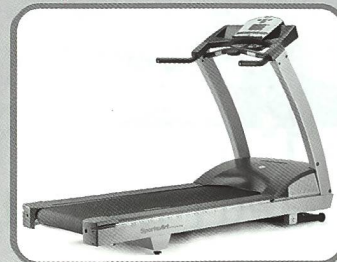
Laufband mit Reversefunktion