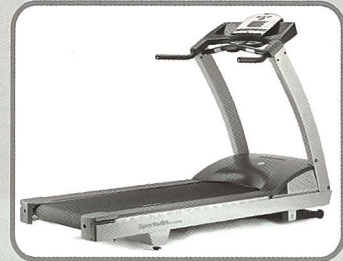
Laufband mit Reversefunktion