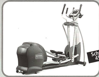
Elliptical mit verstellbarer Schrittlänge