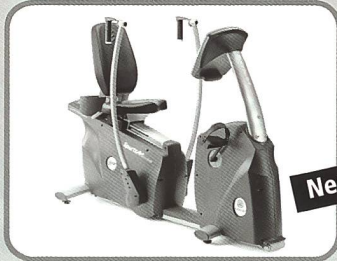
Liegeergometer mit Oberkörpertraining