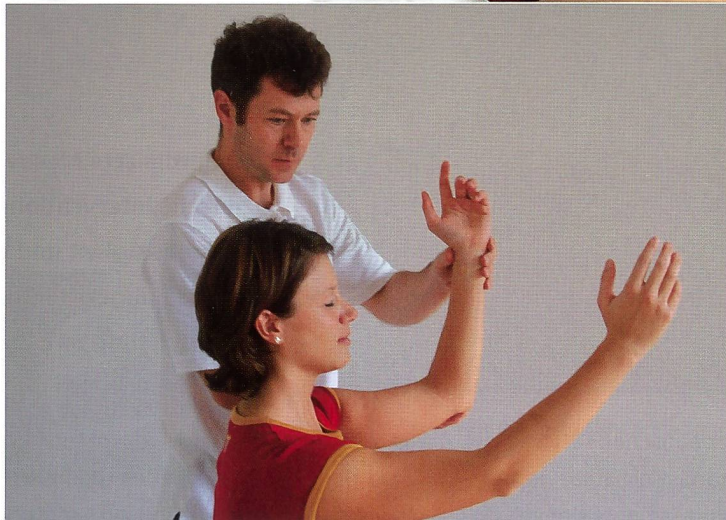
Nur teilweise für Verlaufsmessung geeignet: Manuelle Muskelfunktionsprüfung (Bild oben) und Lage- und Bewegungssinn (Bild unten)