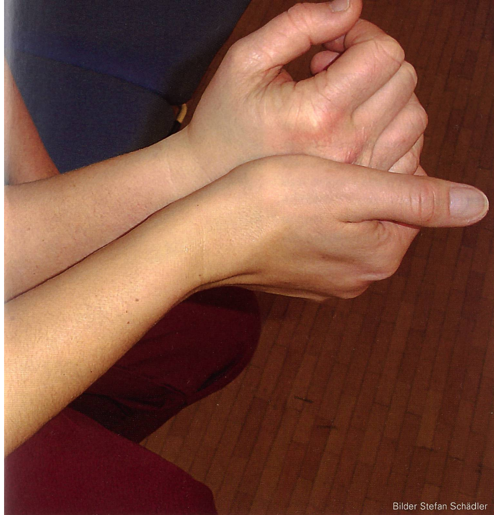
Bilder Stefan Schädler

senschaft) beste Variante verwendet. Dies liegt auch an der Tatsache, dass ein zuverlässigeres Messinstrument einen grösseren Zeitaufwand zur Durchführung benötigt. So verdoppelt sich der zeitliche Aufwand zur Durchführung der Gleichgewichtsmessung von 5 bis 10 Minuten beim POMA auf 10 bis 20 Minuten bei der BBS. Der Ausbildungsbedarf ist mit zwei Stunden beim POMA nur halb so gross wie bei der BBS mit vier Stunden. Weiter steigt z.B. der Aufwand für die Anschaffung einer Kraftmesszelle im Vergleich zur «kostenlosen» manuellen Muskelkraftmessung nicht unerheblich. Schliesslich stellt der Chedoke McMaster Stroke Assessment ein hervorragendes Instrument zur Verlaufsmessung dar, benötigt jedoch zur Durchführung bis zu 60 Minuten. Aus diesen genannten Gründen wird es das Instrument zur Messung eines Kriteriums nicht geben – neben den verschiedenen Gütekriterien ist häufig die Praktikabilität im Alltag entscheidend für eine Anwendung.