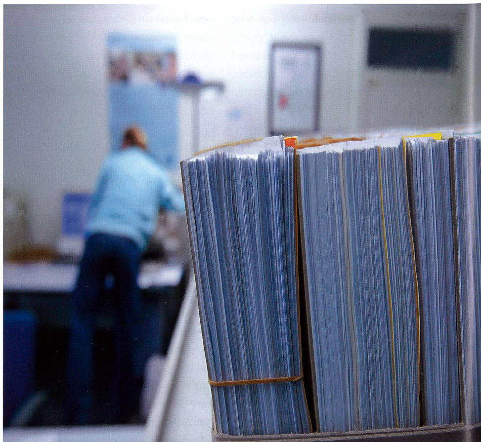
Bei den Physiotherapeuten nehmen die Dossiers unbezahlter Rechnungen zu.

Was können Sie als selbständig erwerbende Physiotherapeutinnen und Physiotherapeuten unternehmen? Sprechen Sie Ihre Patienten auf das Problem an! Falls die Prämienausstände und allfällige Schulden durch den Patienten oder allenfalls durch die Sozialbehörde bezahlt wurden, insistieren Sie bei der Krankenversicherung, dass diese die Kosten der Behandlung übernimmt. Falls Ihnen die Bezahlung weiterhin verweigert wird, leiten Sie den Fall an die Paritätische Vertrauenskommission weiter.