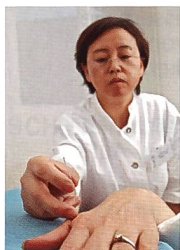
«Traditionelle Chinesische Medizin»