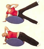
Seitliche Rumpfmuskulatur und äußere Beinmuskulatur

Eine Hüfte aufliegen, Füße und Hand abstützen auf dem Boden, obere Hand liegt hinter dem Kopf. Mit Anspannen des Bauches und Gesäßmuskulatur oberes Bein und Rumpf etwas anheben