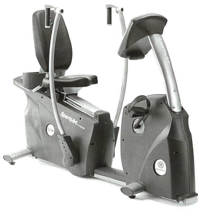
SportsArt FITNESS Krafttrainingsgeräte