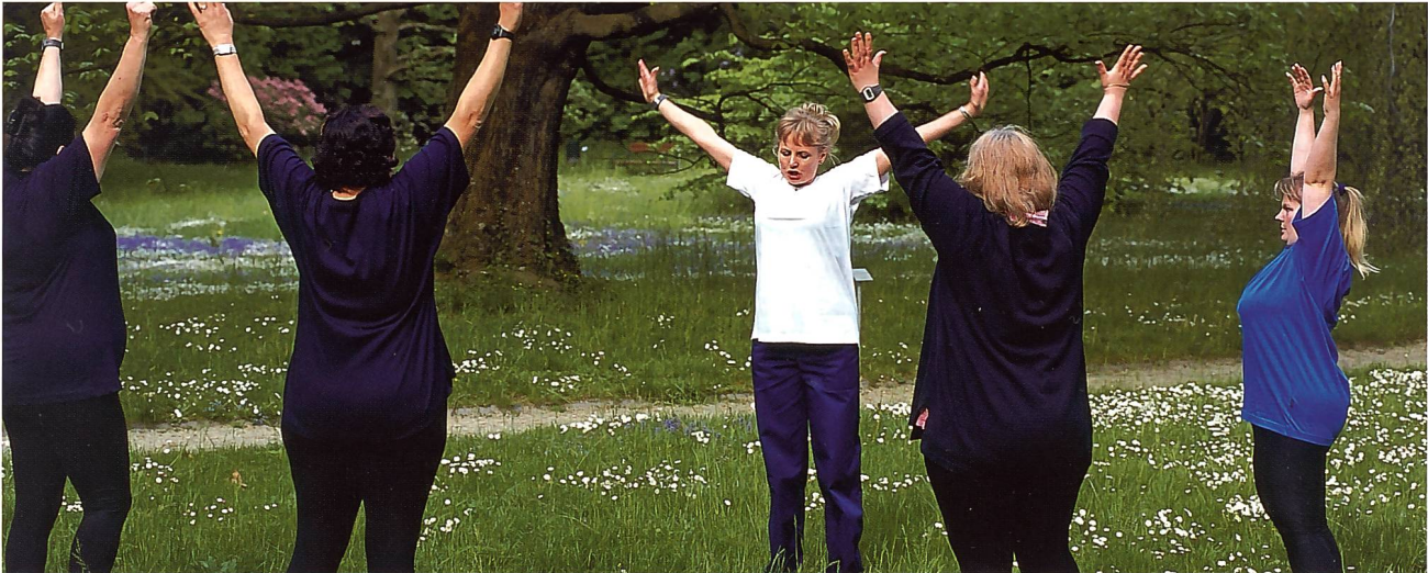
Bilder: Impressionen aus der Gruppentherapie nach bariatrischen Operationen. | Images: Traitement en groupe selon les méthodes bariatriques.

Magendarmabschnitte umgangen, dies vermindert die Nahrungsverwertung, es entsteht eine künstliche Mangelernährung. Zu den malabsorptiven Eingriffen zählen der laparoskopische Magen-Bypass und die biliopankratische Diversion 1 .