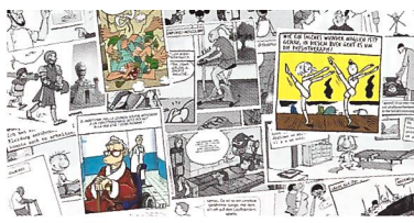
Collage aus dem Comic physio Bild | Image | Imagine : Nadine Strub