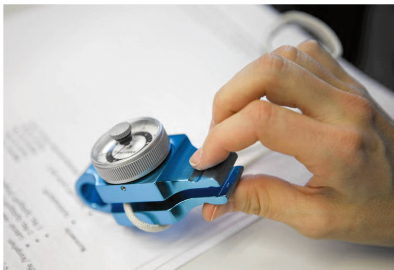
Handtherapie – ein spannender Arbeitsbereich für PhysiotherapeutInnen. | Rééducation de la main – un secteur intéressant pour les physiothérapeutes.

Maintenant que les premiers titulaires d'un Bachelor obtenu dans une haute école spécialisée sont arrivés sur le marché du travail en automne 2009 et que les modalités d'obtention a posteriori du titre HES ont été précisées, il reste à aborder la question de la formation continue au niveau des hautes écoles spécialisées.