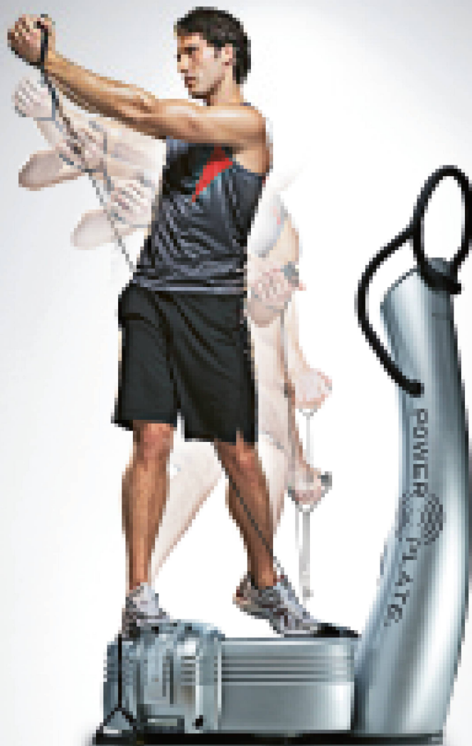
Dieses Power Plate™ enthält patentiertes, hochfrequenz- Vibrations-Technologie- und Systempatenteigenschaften.