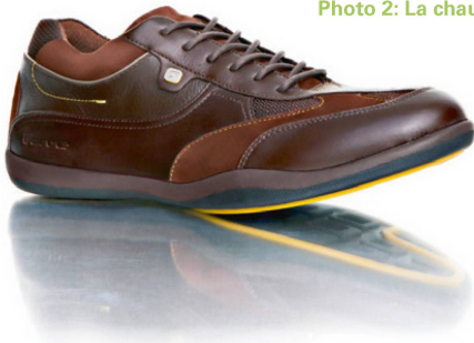
Foto 2: Der getestete Spezialschuh. | Photo 2: La chaussure spéciale testée.