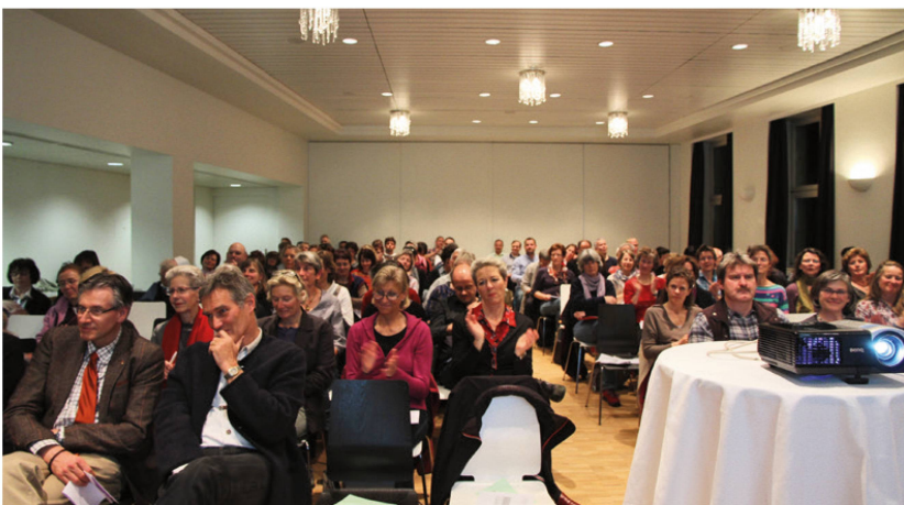
Rund 100 Mitglieder besuchten die Generalversammlung des Regionalverbandes Beider Basel.