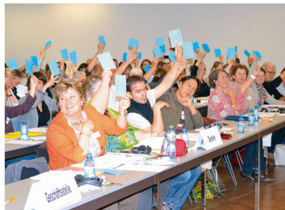
Es herrscht eine gute Atmosphäre in Genf. | Il règnait une bonne ambiance à Genève. | Ottima atmosfera in quel di Ginevra.

vati in cima», ha aggiunto 1 . «Questi candidati al titolo sono tra i pionieri della fisioterapia svizzera.» I delegati hanno approvato il progetto «Specialista clinico physioswiss» a larga maggioranza. Si passa ora alla fase operativa di transizione che durerà fino al 2016. |