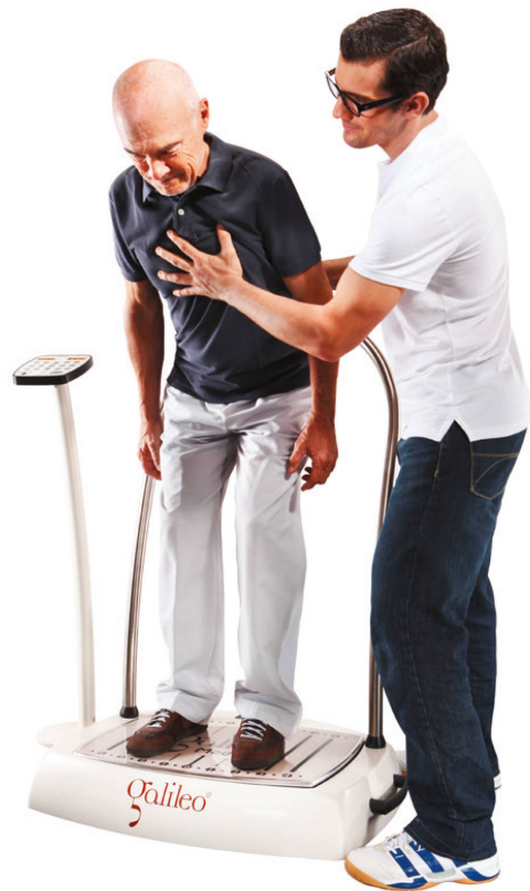
Bei Altersheimbewohnern sank das Sturzrisiko durch Ganzkörper-vibrationstraining. | On a constaté une baisse du risque de chute chez les personnes résidant en maison de retraite.

Bestätigt wurden die mehrheitlich positiven Ergebnisse durch eine Studie von Bogaerts et al. [7]: Die Kraftsteigerungen bei über sechzigjährigen Männern , die einhergehen können mit einer Zunahme der Muskelmasse, sind mit denjenigen eines moderaten, konventionellen Fitnessstrainings durchaus vergleichbar. Und auch eine Untersuchung an jugendlichen Wettkampf-Skifahrern aus Belgien, bei denen ein Krafttraining mit und ohne gleichzeitige Vibration verglichen wurde, kam zu positiven Resultaten [8]. Im Vergleich mit einem konventionellen Krafttraining wird jedoch mit einem GKVT dieselbe Kraftsteigerung mit deutlich kleinerem Trainingsumfang und geringerer körperlicher Beanspruchung erreicht, was besonders für ältere Menschen ideal ist.