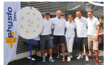
Gemeinsam sind wir stark – die Physiotherapie-Gemeinschaft rechter Thunersee.

Nach dem Motto «Gemeinsam sind wir stark!» wird die Physiotherapie-Gemeinschaft rechter Thunersee auch weiterhin zusammenspannen und Anlässe gemeinsam durchführen. |