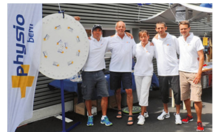
Gemeinsam sind wir stark – die Physiotherapie-Gemeinschaft rechter Thunersee.

Nach dem Motto «Gemeinsam sind wir stark!» wird die Physiotherapie-Gemeinschaft rechter Thunersee auch weiterhin zusammenspannen und Anlässe gemeinsam durchführen. |