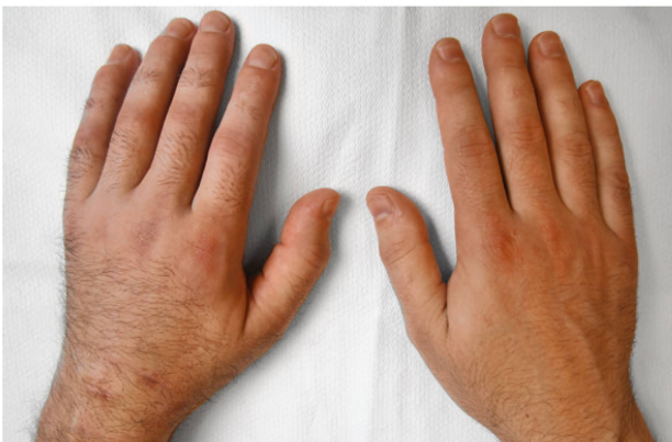
CRPS: Eine Hand (links) mit trophischen Veränderungen. | SDRC: Une main (à gauche) avec des modifications trophiques.

Une étude de cohorte portant sur 102 patients atteints de SDRC a montré que six ans après le début de la maladie, 30% d'entre eux se considéraient comme guéris tandis que 54% gardaient des symptômes; 30% des patients qui exerçaient une activité professionnelle avant la survenue de la maladie n'étaient toujours pas en mesure de la reprendre [2].