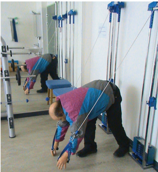
Foto 1: Überdosierung in der MTT bei einem Schmerzpatienten mit körperlicher Wahrnehmungsstörung und Leistenschmerzen. | Photo 1: Surdosage dans la TME chez un patient souffrant de troubles de la perception corporelle et de douleurs inguinales.

Je travaillais à l'époque dans un cabinet de physiothérapie à Wedding. C'est l'un des quartiers où la proportion d'immigrés est la plus importante: 31,5% de la population. Mon patient venait du Kosovo et avait plus de 50 ans. Lors de l'anamnèse, j'avais remarqué son manque de concentration et son faible niveau d'allemand. Il était venu me consulter parce qu'il éprouvait une douleur à la cheville lorsqu'il marchait, suite à une fracture malléolaire survenue trois mois auparavant. Après l'opération, tout s'était remis, mais la musculature du pied était un peu tendue et douloureuse. J'ai donc commencé par la détendre. Dès la première séance, il s'est endormi. Chez lui, il dormait mal, m'a-t-il dit. Pendant une des séances suivantes, je lui ai demandé pourquoi il était venu en Allemagne. Il m'a alors raconté son histoire en détail. Il avait été expulsé, emprisonné et torturé pour des raisons ethniques. J'étais très impressionné. Je n'avais jamais entendu un récit aussi réaliste de ce qui s'était passé pendant