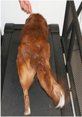
Abbildung 6: Hund auf Laufband. | Illustration 6: Chien sur tapis de course.