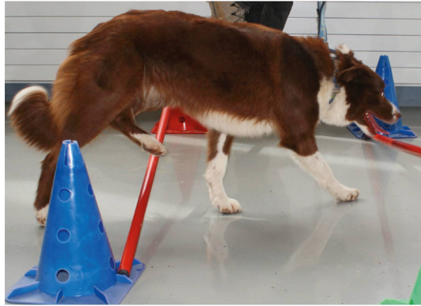
Abbildung 7: Koordination und aktive Mobilisation: Hund läuft über Kavaletti. | Illustration 7: Coordination et mobilisation active: le chien court sur des cavalettis.

halten hat, was eine Praxisassistentin spart. Nur ganz wenige Hunde müssen im Sitzen behandelt werden, weil sie die erzwungene Haltung nicht dulden. Sedationen werden ganz selten eingesetzt, sie unterdrücken oder verspäten auch die Kommunikationszeichen des Hundes.