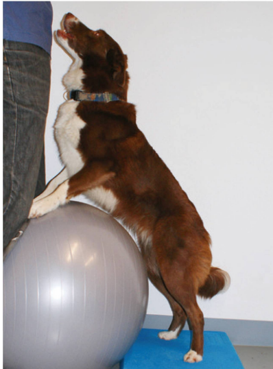
Abbildung 8: Kräftigung der Hintergliedmassen mittels Hochstand auf instabiler Unterlage. | Illustration 8: Renforcement des membres postérieurs au moyen d'une position haute sur support instable.

derholungen sind zu beachten. Der Hund sollte dafür mehrmals pro Woche trainieren.