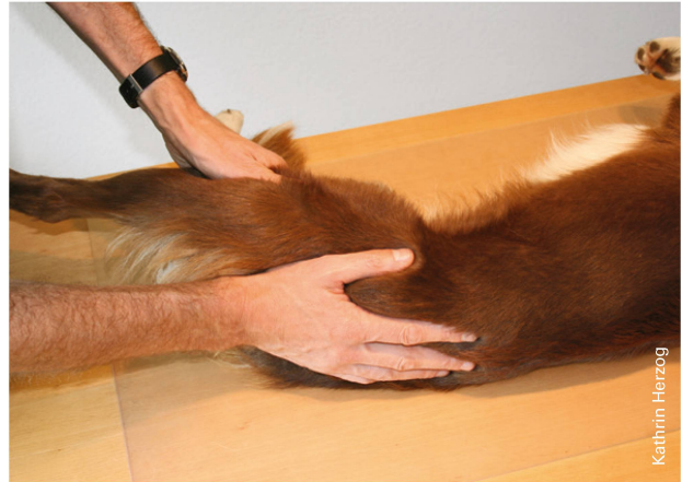
Abbildung 5: Hüftextension in Seitenlage. | Illustration 5: Extension des hanches en position allongée sur le côté.

Patellasehne kann bei der TTA empfindlich sein, wegen der veränderten Biomechanik muss sie eine grössere Kraftübertragung ertragen. Selbstverständlich sind die operativen Folgen (die Platte, die versetzte Tuberositas tibiae und der extracapsuläre Bandersatz) beider Operationen gut palpierbar.