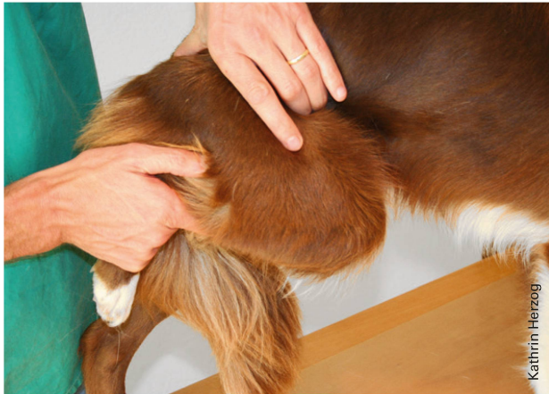
Abbildung 4: Knieflexion im Stehen. | Illustration 4: Flexion du genou en position debout.