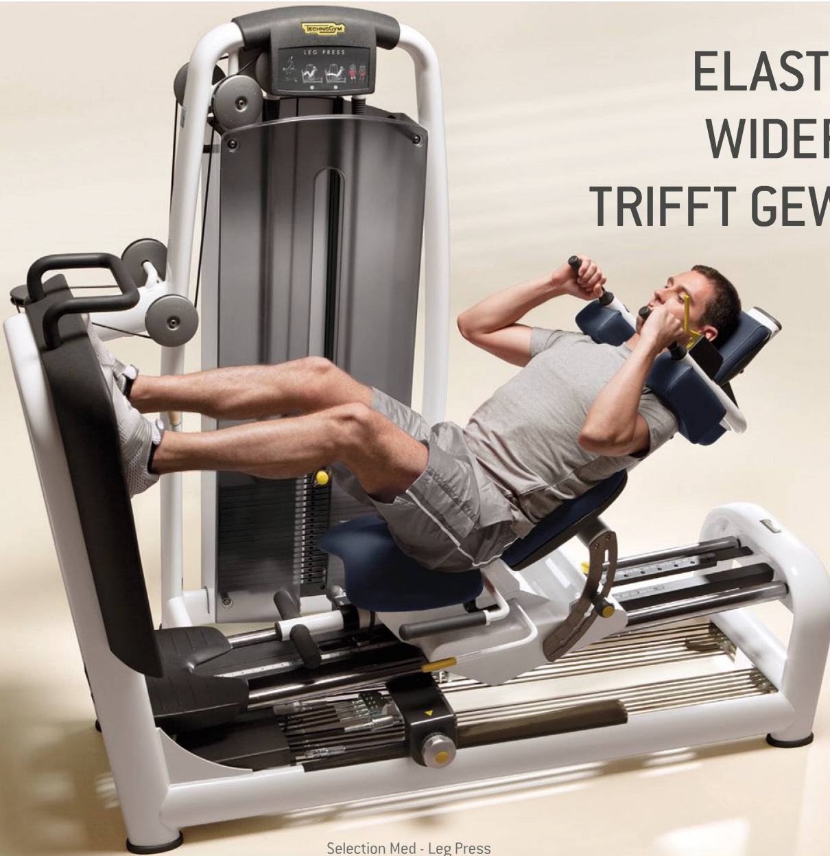
Selection Med - Leg Press