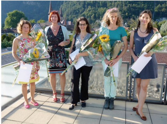
Erste MAS-Absolventinnen in «pelvic physiotherapy».

Diesen Sommer haben die ersten sechs Physiotherapeutinnen in der Schweiz den Master of Advanced Studies (MAS) in pelvic physiotherapy abgeschlossen. Durchgeführt wird die Weiterbildung am SOMT in Interlaken, einer in Holland anerkannten Fachhochschule. Mit der Spezialisierung werden Kenntnisse und Fähigkeiten in der Prävention, Diagnostik und Therapie bei Frauen, Männern und Kindern mit Funktionsstörungen im urogenitalen, anorektalen, sexuellen und muskuloskelettalen System gelernt und angewendet. Die Muskelfunktionsuntersuchung des Be-