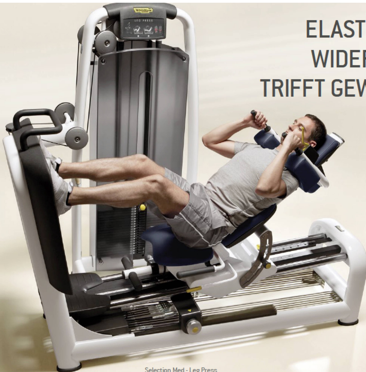
Selection Med - Leg Press