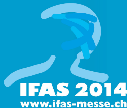
Exhibit & More AG · Bruggacherstrasse 26 · Postfach 185 · CH-8117 Fällanden-Zürich T +41 (0)44 806 33 77 · F +41 (0)44 806 33 43 · info@ifas-messe.ch · www.ifas-messe.ch