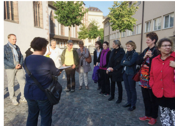
Spannende Führung durch Basel.

Der krönende Abschluss war der gemeinsame Apéro mit Imbiss im Cliqueneller der Stainlemer Alti Garde am Nadelberg. In einem der ältesten Häuser Basels, unter den hohen Kuppen des