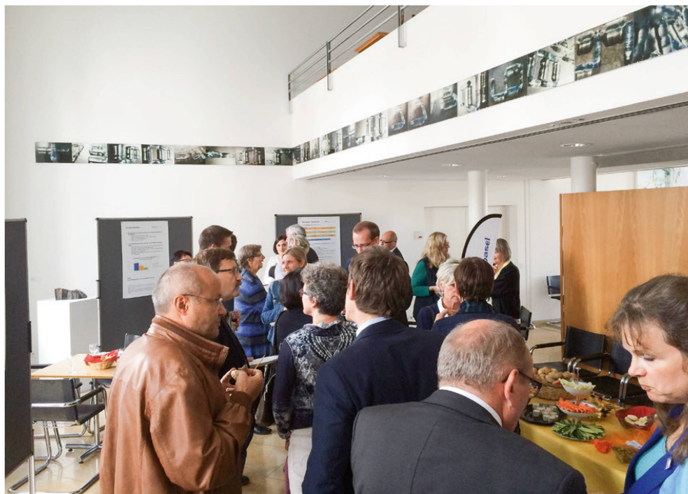
Gute Diskussionen zwischen den Politikern und Physiotherapeuten.

gungsapparat dar (Gesamtkosten, Kosten für Hospitalisation pro Tag, Kosten für ein MRI). Hospitalisation, MRI und 9x Physiotherapie werden anschliessend grafisch im Vergleich dargestellt.