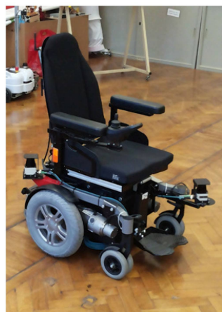
Foto: Elektrischer Rollstuhl mit PMK (Name: Red PuMpKin). | Photo: Fauteuil roulant électrique avec PMK (nom: Red PuMpKin).