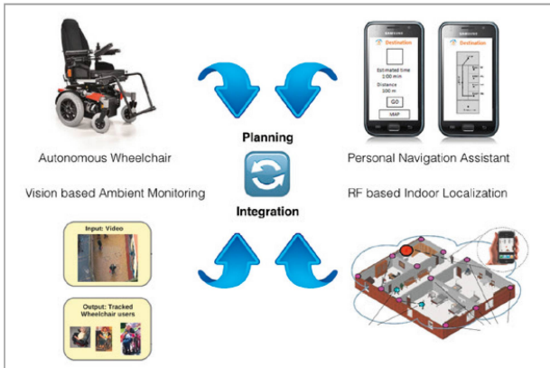
Abbildung 2: ALMA-Projekt (overview). | Illustration 2: Projet ALMA (overview).