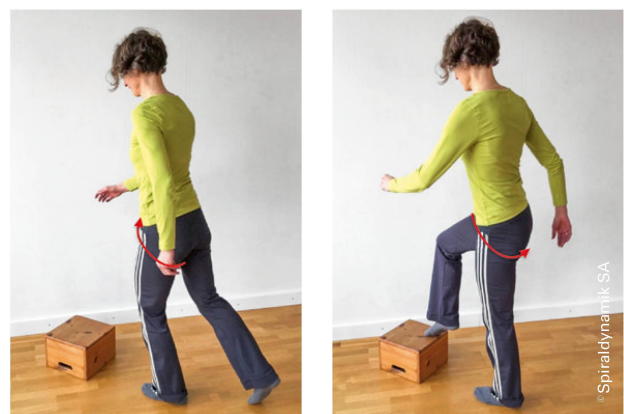
Bilder 1: Schritt auf Stufe. | Photo 1: Un pas sur une marche d'escalier.

Mettez-vous en position de marche face à une marche d'escalier: votre jambe droite se trouve à l'arrière et la gauche est devant. Déplacez votre poids sur la jambe avant et posez lentement le pied droit sur la marche. Le bassin bouge au niveau