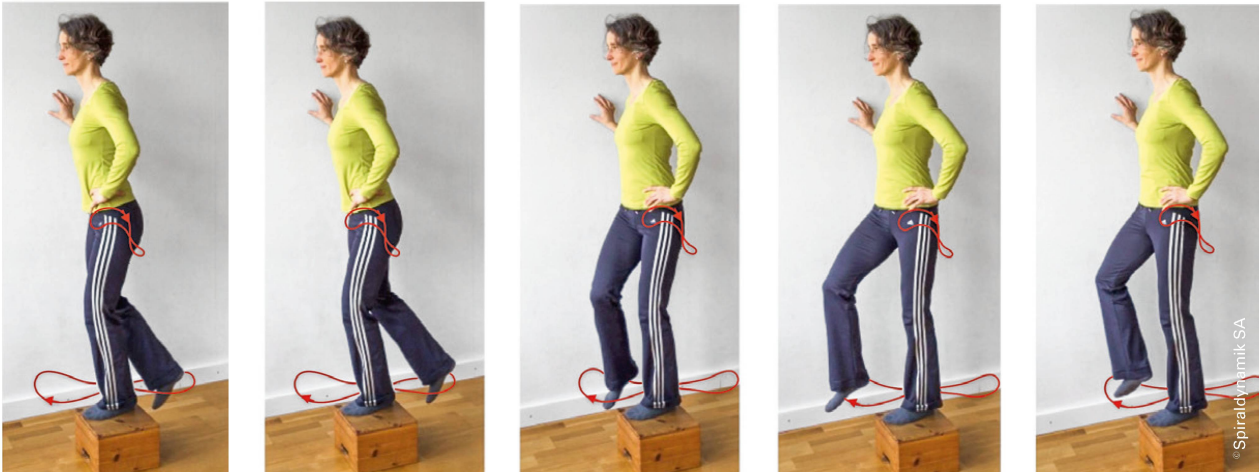
Bilder 2: Achterbewegung Hüftgelenk. | Photo 2: Les mouvements en huit de la hanche.

Derselbe Mechanismus führt in den fächerförmig verlaufenden kleinen Glutea zu einer alternierenden Aktivierung der dorsalen und ventralen Anteile – ein wirksamer Überlastungsschutz [3].