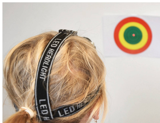
Abbildung 6: Joint reposition error test. | Illustration 6: Joint reposition error test.

Dans un deuxième temps, un examen physique et des mouvements combinés permettent de déterminer si les douleurs proviennent plutôt de la colonne cervicale supérieure ou inférieure (illustrations 2a+b). Les tests de provocation segmentaires peuvent fournir d'autres indices pour localiser le problème. Pour cela, les physiothérapeutes peuvent se référer à des tests issus de différents concepts de thérapie manuelle tels que Maitland, Mulligan ou Kaltenborn-Evjenth