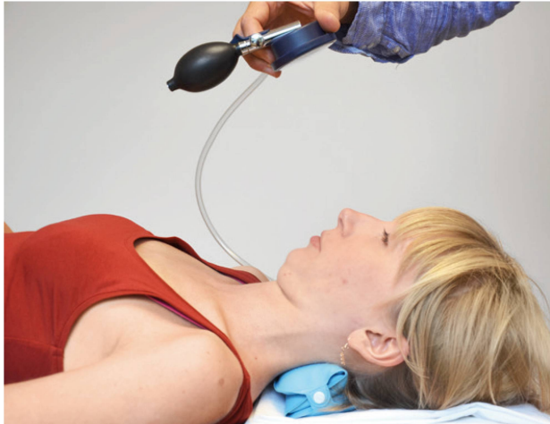
Abbildung 7: Test der tiefen Halsflexoren mit einer Druck-Biofeedbackeinheit. | Illustration 7: Test des fléchisseurs profonds du cou avec un biofeedback de pression.

Druck-Biofeedbackeinheit eingesetzt, sie misst den Druck der tiefen Halsflexoren während des CCFTs in mmHg. Wahrscheinlich auch aufgrund fehlender Reliabilität des klinischen Tests [6] wurde ein Performance-Index entwickelt. Er macht eine Aussage zum Druckwert, bei dem die Ausführung noch korrekt ist, sowie dazu, wie häufig eine 10 Sekunden gehaltene korrekte Anspannung wiederholt werden kann. Die Beurteilung der Qualität der korrekten Anspannung bleibt in der Kompetenz der Physiotherapeutin. Das Training der tiefen Halsflexoren wird anhand dieses Index gesteuert.