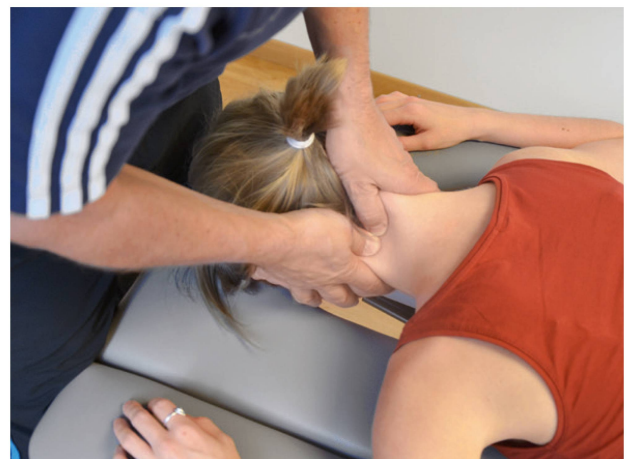
Abbildung 3: Segmentaler Provokationstest nach Maitland: hier C2 unilateral. | Illustration 3: Test de provocation segmental selon Maitland: ici, le C2 unilatéral.

Les formes mécaniques non spécifiques sont les douleurs cervicales les plus fréquentes. En raison de son origine, le traumatisme cervical est considéré comme une entité à part. Si l'anamnèse indique qu'il s'agit de douleurs cervicales non traumatiques et non spécifiques ainsi qu'en l'absence de drapeaux rouges, l'examen physique consiste en premier