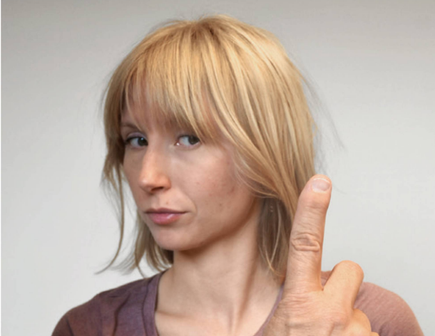
Abbildung 9: Beispiel eines Kopf-Augen-Koordinationstests. Kann die Patientin die Augen und den Kopf in Gegenrichtung bewegen? | Illustration 9: Exemple d'un test de coordination entre les yeux et la tête. Le patient est-il capable de bouger ses yeux et sa tête en sens contraire?

tests [10] und bei Befunden entsprechende Interventionen (Abbildung 9).