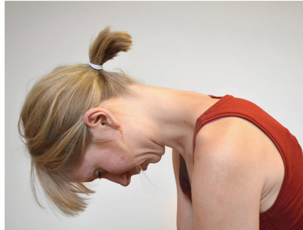
Abbildung 5: Test und Dehnung der Lig. nuchae: Kinn einziehen und den Kopf hängen lassen. Normalerweise erreicht man mindestens die horizontale Ebene mit der HWS. | Illustration 5: Test et étirements du ligament nuchal: il s'agit de rentrer le menton et de laisser pendre la tête. Normalement, on atteint au moins le niveau horizontal avec la colonne cervicale.

ten die neutrale Kopfposition aus verschiedenen Bewegungsrichtungen, wie Rotation oder Flexion/Extension, und unter Ausschluss des Visus, wiederfinden (Abbildung 6). Frühe Studien aus den 90er-Jahren erklärten einen Grenzwert von \geq 4,5^\circ Abweichung als indikativ für eine eingeschränkte Propriozeption [4]. Dies konnten spätere Studien jedoch nicht mehr bestätigen. Klar scheint, dass Patienten nach Schleudertrauma (Whiplash), insbesondere wenn sie über Schwindel klagen, grössere Schwierigkeiten haben, ihre neutrale Kopfposition mit geschlossenen Augen wiederzufinden. Einfache Vorrichtungen mit einem Laserpointer und einer Zielscheibe machen das Assessment praktikabel. Jedoch sollte dabei auf eine standardisierte Vorgehensweise geachtet werden. Das JPET-Manöver soll langsam ausgeführt werden, um den Einfluss des vestibulären Organs auf den Test zu reduzieren.