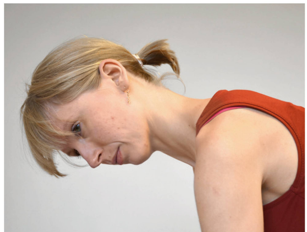
Abbildung 8: Beispiel eines Bewegungskontrolltests der HWS: Bleibt die Rotationsachse gerade oder weicht die Patientin aus, zum Beispiel in die Protraktion? | Illustration 8: Exemple d'un contrôle des mouvements de la colonne cervicale: l'axe de rotation reste-t-il droit ou le patient effectue-t-il un mouvement d'évitement, par exemple la protraction?

Le Joint position error test (JPET) constitue un des moyens d'évaluation sensorimotrice les plus connus. Les patients doivent y retrouver une position de tête neutre depuis différentes directions de mouvement, telles que la rotation ou la flexion/extension; également les yeux fermés (illustration 6). Les premières études des années 90 avaient montré qu'une valeur limite de \geq 4,5^\circ de divergence indiquait une proprioception restreinte [4]. Cela n'a toutefois pas été confirmé par les études ultérieures. Il semble cependant clair que les patients qui ont subi un traumatisme cervical (coup du lapin), surtout ceux qui se plaignent de vertiges, ont plus de difficultés à retrouver la position de tête neutre les yeux fermés. La simplicité du dispositif utilisé, un pointeur laser et une cible, en fait une évaluation facilement réalisable. Il s'agit toutefois de