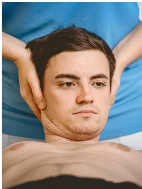
Abbildung 1: Der zervikale Flexions-Rotations-Test. | Illustration 1: Le test de flexion-rotation cervicale.

Der beim zervikogenen Kopfschmerz am häufigsten eingesetzte Fragebogen ist der «Neck Disability Index» (NDI). Er erhebt Schmerz und Behinderung. Der NDI wurde auf Deutsch übersetzt und validiert, er gilt als verlässliches Instrument [11, 12]. Eine Alternative bei chronischen Kopfschmerzen stellt das Inventar zur Beeinträchtigung durch Kopfschmerzen (IBK) dar [13].