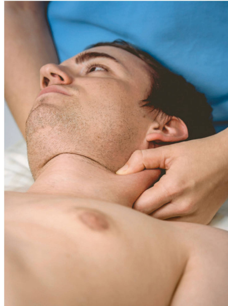
Abbildung 5: Triggerpunktbehandlung im M. sternocleidomastoideus. | Illustration 5: Traitement manuel des trigger points dans le m. sternocleidomastoideus.

Eine weitere Subgruppe stellt der zervikogene Kopfschmerzpatient dar, der zugleich unter einer temporomandibulären Dysfunktion (TMD) leidet 4 . Spätestens dann, wenn