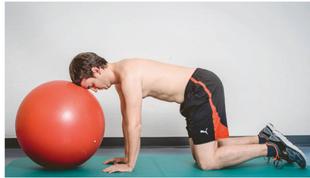
Abbildung 4: Zervikale Stabilisationsübung. | Illustration 4: Exercice cervical de stabilisation.

Eine Übungsform, die ebenfalls einen spezifischen Nutzen beim zervikogenen Kopfschmerz bringen könnte, stellen die sogenannten SNAGs dar (sustained natural apophyseal glides). Die vom Neuseeländer Brian Mulligan entwickelte Methode kombiniert aktive Bewegung mit manueller Therapie ( Abbildung 3 ). In einem kleinen RCT (32 Studienteilnehmer) konnten Hall et al. (2007) bei zervikogenen Kopfschmerzpatienten einen Benefit mit SNAGs als Selbstanwendung aufzeigen [25]. Eine ähnlich konzipierte Studie von Shin et al. (2014) mit therapeutischer SNAG-Technik kam bei Frauen