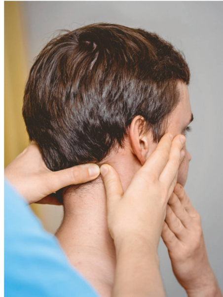
Abbildung 3: SNAGs (sustained natural apophyseal glides) kombinieren aktive Bewegung mit manueller Therapie. | Illustration 3: Les SNAGs (sustained natural apophyseal glides) combinent les mouvements actifs à la thérapie manuelle.

Racicki et al. (2013) kommen in ihrer systematischen Review zum Schluss, dass beim zervikogenen Kopfschmerz