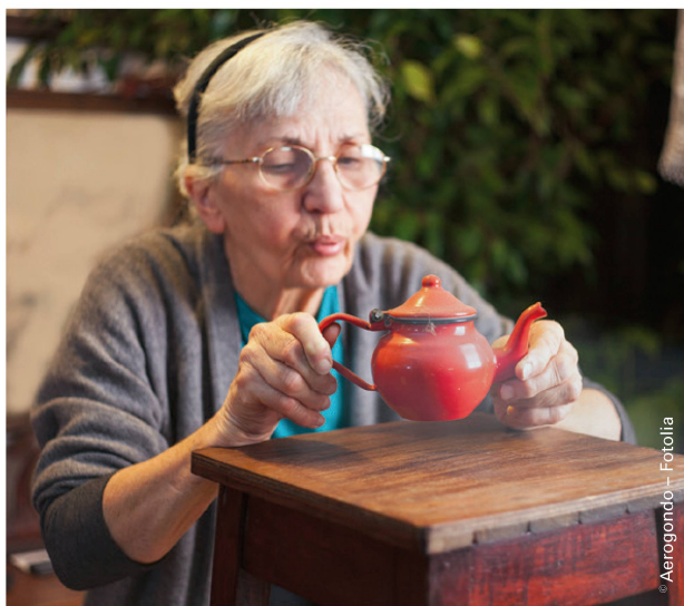
Die PatientInnen waren mit der interprofessionellen Nachbetreuung zufrieden bis sehr zufrieden. | Les patients ont tous été satisfaits ou très satisfaits du suivi interprofessionnel.