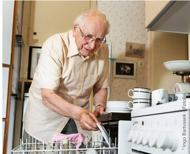
Einige PatientInnen konnten nach der Entlassung noch beachtliche Fortschritte machen. | Certains patients ont même fait des progrès supplémentaires considérables.

blique puisque, grâce à son efficacité, cette collaboration permet d'économiser les frais onéreux causés par des soins de longue durée.