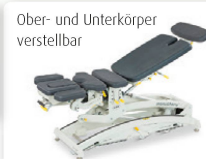
Ober- und Unterkörper verstellbar