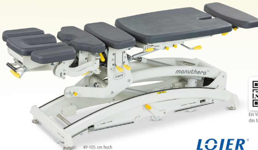
49-105 cm hoch