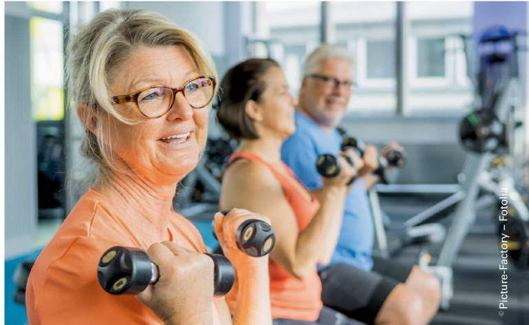
Das Training bei MS ist etwas weniger intensiv gestaltet, ähnlich wie bei Menschen, die mit einem Krafttraining anfangen. | L'entraînement en cas de SEP est semblable à celui des personnes qui commencent la musculation.

Nimmt der Behinderungsgrad zu, gestaltet sich ein Training schwieriger. Ein Grund dafür sind sicherlich die bereits eingeschränkten Möglichkeiten zur funktionellen Reorganisation des Gehirns. Der Patient und die behandelnde Physiotherapeutin sollten rechtzeitig erkennen, wann Kraft- und Ausdauertraining für die betroffenen Körperpartien nicht mehr angebracht sind, das heisst der Aufwand zu gross und das Resultat zu gering ist. In diesem Stadium hat oberste Priorität, den Zu-