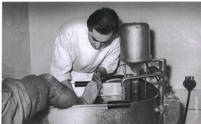
Traitement physiothérapique par masse d'eau mouvante

Behandlung im «Whirlpool», 1955 frisch aus den USA importiert [1]. | Traitement réalisé dans un appareil d'hydromassage tout juste importé des États-Unis en 1955 [1]. | Trattamento realizzato in un apparecchio d'idromassaggio appena importato dagli Stati Uniti nel 1955 [1].