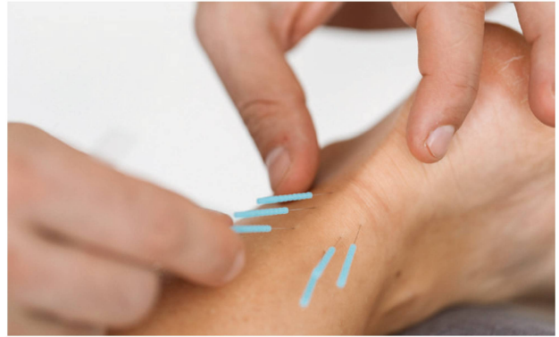
Superfizielle Affferenz-Stimulation. | Stimulation superficielles des afférences.

Das Dry Needling steht vor allem für die Behandlung von myofaszialen Schmerzen und Dysfunktionen, bei der ver-