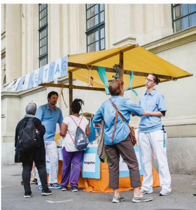
Standaktion am Bahnhof Bern. | Le stand à la gare de Berne. | Lo stand alla stazione di Berna.

L 'attività per una vita sana: il 7 settembre, l'istituto di fisioterapia dell'ospedale universitario di Berna ha celebrato per la terza volta la giornata mondiale della fisioterapia con delle attività sulla Piazza della Stazione di Berna. Le/gli esperte/i dell'istituto hanno dato consigli alle/ai passanti interessate/i riguardanti una maggiore attività fisica nella vita di tutti i giorni. Per tutto il giorno hanno anche risposto alle domande sui problemi di salute individuali. Grazie a una varietà di hashtag e codici QR per accedere ai siti Internet di physioswiss, dell'università e dell'ospedale si sono rivolte/i anche a un pubblico giovane. Secondo noi la giornata è stata un grande successo. Pertanto, manterremo questo formato per celebrare la prossima giornata mondiale della fisioterapia che si terrà il 6 settembre 2019. |