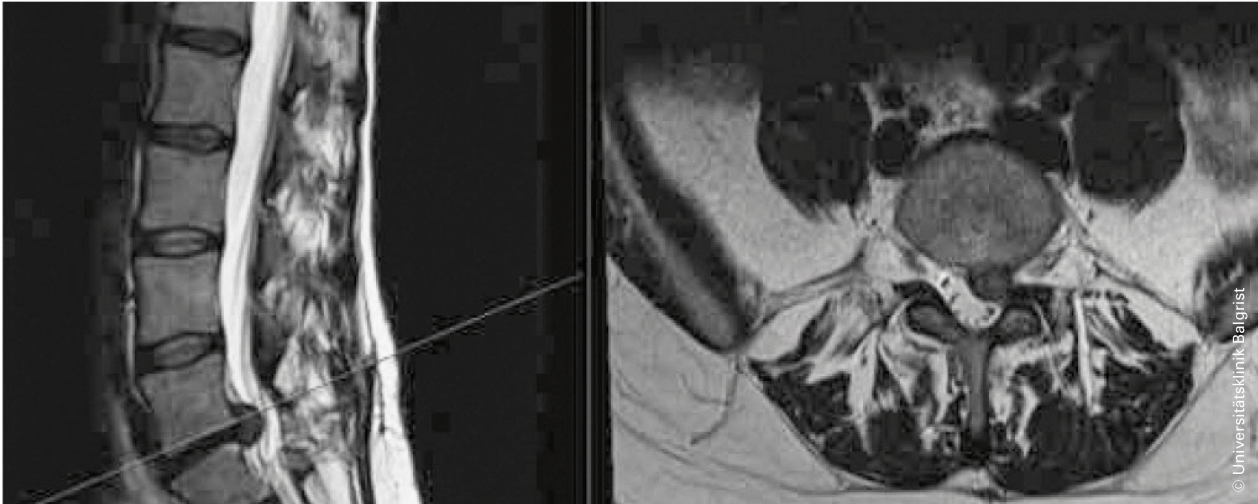
Diskushernie: Bandscheibengewebe verlagert sich über die normalen Grenzen des Intervertebralraums hinaus [3]. | Hernie discale: déplacement localisé de matériel discal au-delà des marges normales de l'espace interdiscal [3].

rasch endoskopische Ansätze unter Lokalanästhesie entwickelt. Randomisierte Studien zeigen heute, dass die minimal-invasive Chirurgie für die Patienten vorteilhafter ist: Sie verursacht nicht mehr Komplikationen als offene Zugänge, verringert den Blutverlust und verkürzt den Spitalaufenthalt [5]. Die Techniken werden je nach Pathologie gewählt, nachfolgend ein Überblick.